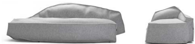
AIRBERG Soffa & Fåtölj Av Jean-Marie Massaud