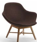
PALMA WOOD Fåtölj Av Khodi Feiz