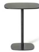
NOBIS Bord Av Claesson Koivisto Rune