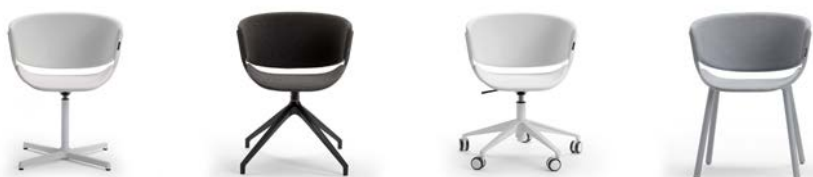
PHOENIX Stol Av Luca Nichetto