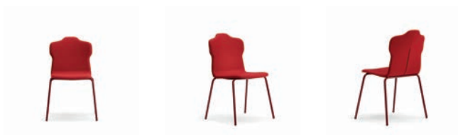
JACKET Stol Av Claesson Koivisto Rune