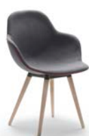
PALMA MEETING WOOD Stol Av Khodi Feiz