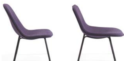
PAL HIGH & LOW Fåtölj Av Claesson Koivisto Rune