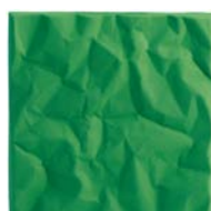
SOUNDWAVE® SCRUNCH Akustikpanel Av Teppo Asikainen